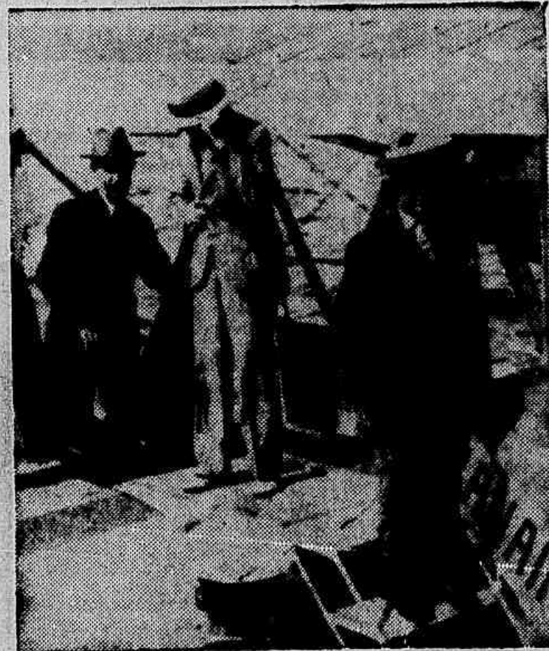
Flagrante do desembarque do capitão Juracy Magalhães

O capitão Juracy Magalhães viajou em avião da Panair